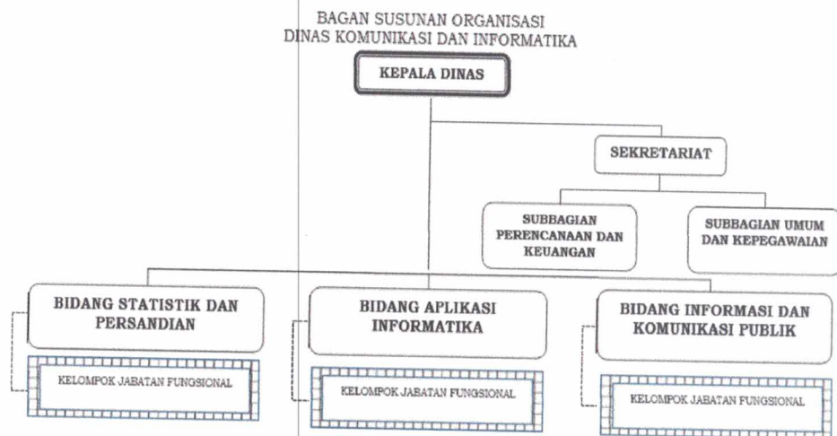
Gambar 1.1 Struktur Organisasi Dinas Komunikasi dan Informatika Kota Salatiga

Perangkat daerah dibentuk berdasarkan Peraturan Daerah Nomor 9 tahun 2016 tentang Perubahan Atas Peraturan Daerah Kota Salatiga Nomor 10 Tahun 2008 tentang Pembentukan dan Susunan Perangkat Daerah dan Peraturan Wali Kota Salatiga Nomor 22 Tahun 2024 tentang Organisasi dan Tata Kerja Dinas Komunikasi dan Informatika, maka susunan organisasi Dinas Komunikasi dan Informatika Kota Salatiga adalah sebagaimana Gambar 1.1 berikut ini: